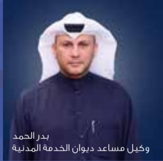
بدر الحمد وكيل مساعد ديوان الخدمة المدنية