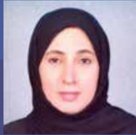
أ. هيام الدويلة برنامج إعادة الهيكلة