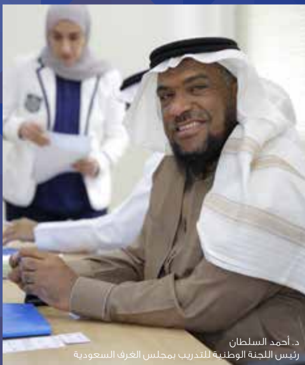
د. أحمد السلطان رئيس اللجنة الوطنية للتدريب بمجلس الغرف السعودية

وقد كانت الزيارة بهدف التعرف على جهود المركز واسهاماته وإمكاناته في دعم وإعداد الخطط المناسبة لتأهيل الشباب وحسن إعدادهم وبرامج المركز القيادية لتمكين الشباب ودور الجهات المختصة في عرض أفضل الممارسات لتأهيل الكوادر الوطنية من خلال المشاريع الصغيرة والمتوسطة والمبادرات والتعرف على النظم والخدمات الآلية للكليات والمعاهد ونظام التعليم الإلكتروني والمشاريع الأخرى المقدمة من الصندوق الأهلي للتعليم التطبيقي والتدريب ومكتب ضبط الجودة والاعتماد الأكاديمي وإدارة المعاهد الأهلية وعمادة خدمة المجتمع والتعليم المستمر.